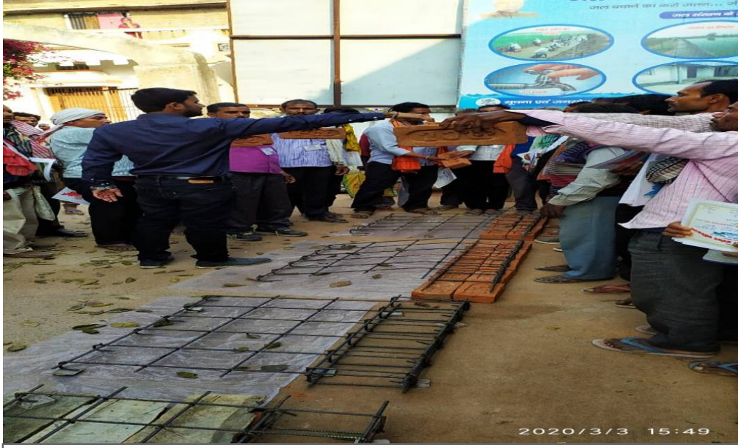
Mason Training on 26-29 February 2020 at Saran District