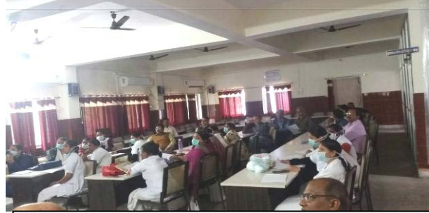
भागलपुर मेडिकल कॉलेज, भागलपुर

इस बैठक के बाद 18 फरवरी, 2020 को अनुग्रह नारायण मगध मेडिकल कॉलेज एवं अस्पताल, गया तथा दिनांक 19 फरवरी, 2020 को भागलपुर मेडिकल कॉलेज, भागलपुर में एक दिवसीय बैठक का आयोजन किया गया। बैठक में प्राधिकरण द्वारा अस्पताल अग्नि सुरक्षा से जुड़े हितभागियों की क्षमतावृद्धि की गई। अग्नि सुरक्षा के प्रति जागरूकता लाने के उद्देश्य के अस्पताल के सभी कर्मियों सहित, सरकार के संबंधित अधिकारियों, सुरक्षा कर्मियों एवं कर्मचारियों ने बैठक में भाग लिया।